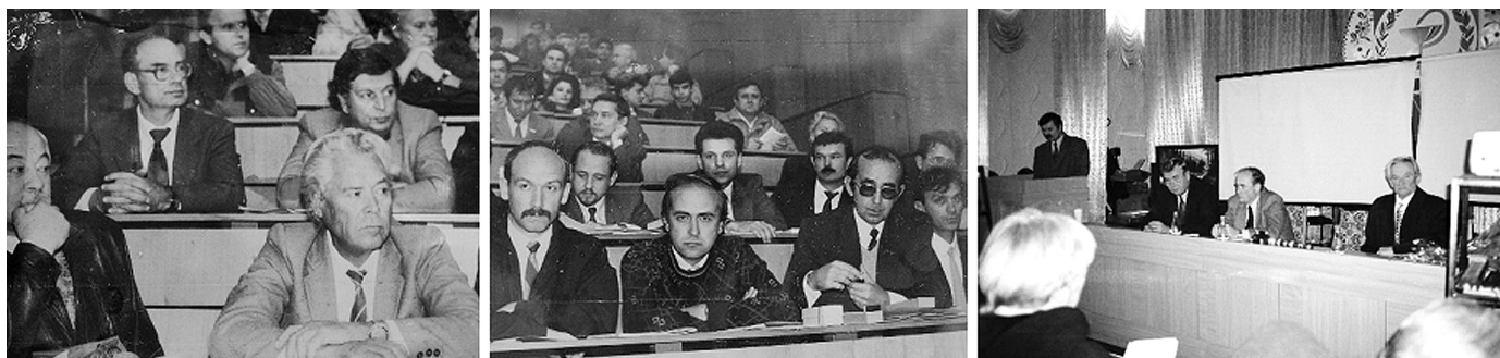
October 1985, first Ukrainian monothematical conference "Treatment of Hand Injuries and their Consequences"