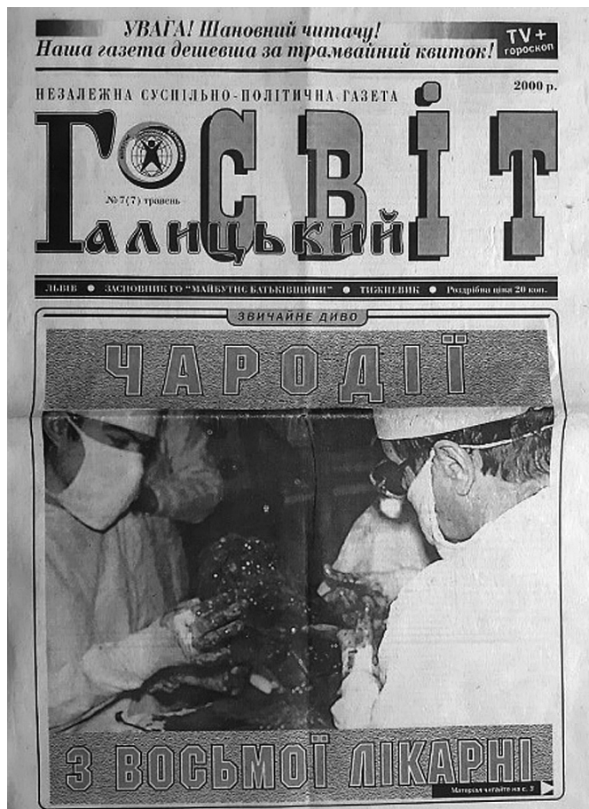
Newspaper Headline: Magicians from Eighth Hospital. About microsurgical limb replantation in Lviv

of polystructural upper extremity trauma, including gunshot wounds; surgical treatment of Dupuytren's contracture; treatment of tendinopathy; reconstructive interventions for upper extremity fractures and their consequences; treatment of congenital pathology of the hand; development of external fixation devices for hand fractures treatment; replantation of the upper extremity segments.